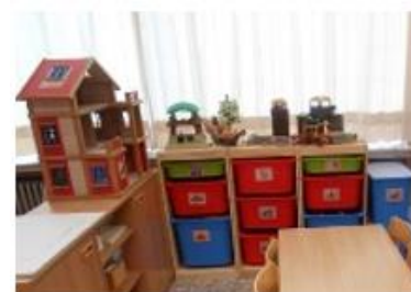
Foto's op speelgoeddozen

Visualisatie van de ruimte kan voor orde en structuur zorgen. Zo kan je aanduiden welk speelgoed in welke doos hoort. Dit kan aan de buitenkant van de doos als aan de binnenkant. Verder zorgt het voor herkenning en duidelijkheid als je 'zones' in een ruimte visualiseert. Denk maar aan de blokkenhoek, het toilet, de plaats voor een rugzak enz. Een kind kan hierdoor zelfstandiger zijn weg vinden en weten wat er verwacht wordt. Dit zorgt dan weer voor meer zelfvertrouwen en autonomie. Gebruik deze visualisaties steeds op een logische plaats.