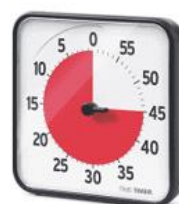
Een Time Timer

Visualisatie van tijd kan ook om aan te duiden hoelang iets duurt. Dit kan bijvoorbeeld door een 'Time Timer'. Kinderen krijgen hierdoor meer tijdsbesef. We bieden voorspelbaarheid aan. Bv. Het einde van een tof moment wordt zo sneller geaccepteerd en de overgang wordt makkelijker.